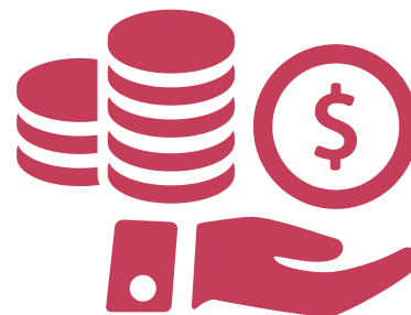
ОБСЯГ СУБВЕНЦІЇ ДЛЯ ОТГ

ЧИМ БІЛЬША КІЛЬКІСТЬ СІЛЬСЬКИХ ЖИТЕЛІВ ТА ПЛОЩА ТЕРИТОРІЇ, ТИМ БІЛЬШИЙ ОБСЯГ СУБВЕНЦІЇ ОТГ.