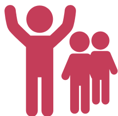
КІЛЬКІСТЬ НАСЕЛЕННЯ ОТГ