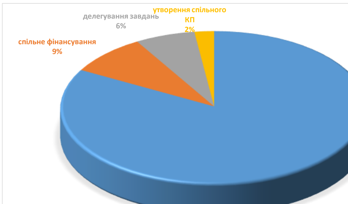
Рис. 2 Структура форм співробітництва, за якими упродовж 2014-2016 рр. в Україні були укладені договори про співробітництво територіальних громад

23,4% опитаних виступили ініціаторами співробітництва, 93,6% вказали, що раніше ними підписані договори залишаються чинними. 25,5% респондентів мають наміри у подальшому укласти новий договір про співробітництво територіальних громад, предметом якого виступатиме: