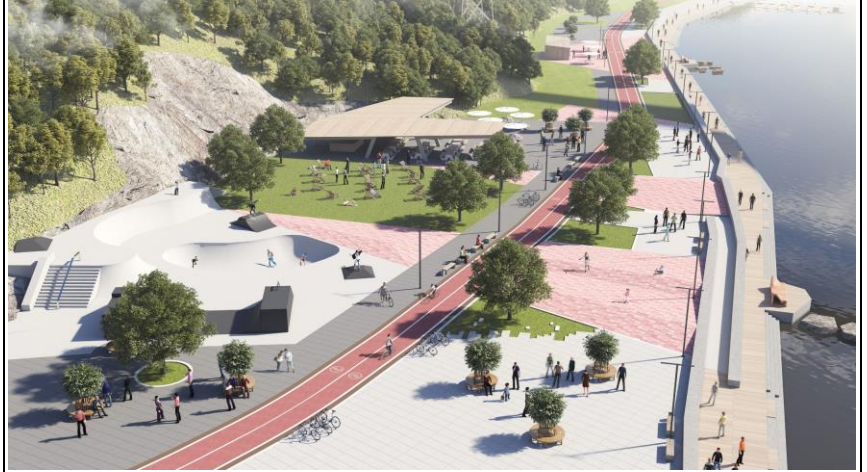
Ескізні проектні рішення благоустрою території набережної річки Тетерів в місті Житомирі

Ділянка на центральній частині ділянки (острівцець) планується більш природною та спокійною. Тут планується облаштувати пішохідні та вело доріжки, місця відпочинку, а також відкрита багатофункціональна сцена для культурно-масових заходів, показів кіно тощо.