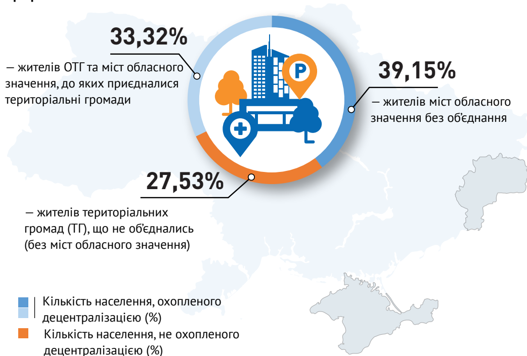
Графік 2. Населення

В той же час залишаються розбіжності щодо кількісної оцінки створення ОТГ. Приміром, прихильники децентралізації вказують на статистичні дані Міністерства розвитку громад та територій, які показують, що понад 70% населення