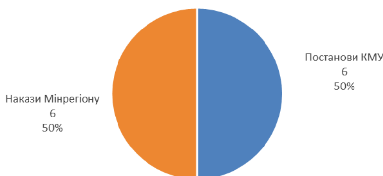
Рис. 2. Структура прийнятих регуляторних актів у 2020 році, одиниці та відсотки

У разі планування проектів регуляторних актів не віднесених до Плану регуляторної діяльності, Мінрегіоном буде забезпечено розроблення та прийняття наказів про внесення відповідних змін до Плану проектів регуляторних актів на 2021 рік.