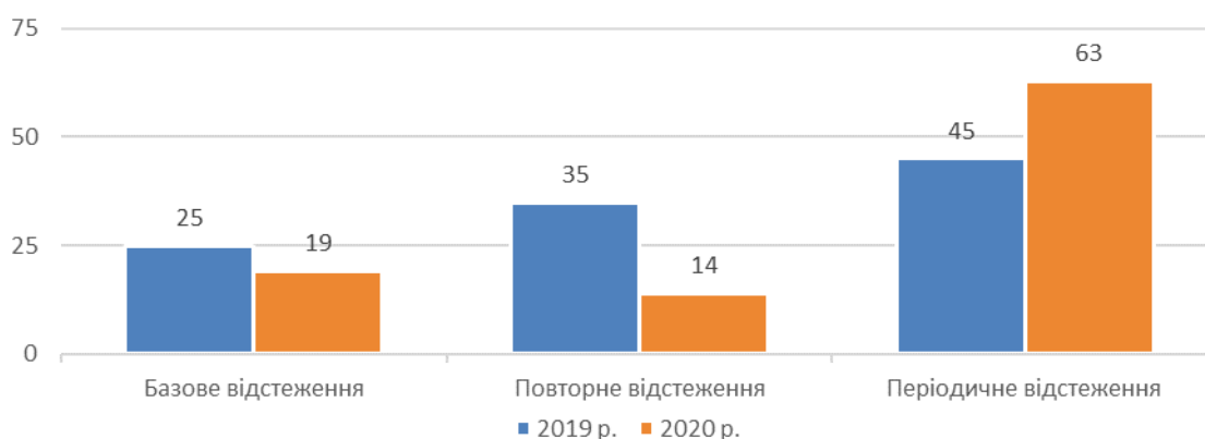
Рис. 4: Структура відстеження результативності регуляторних актів у 2019 та 2020 роках

При цьому у 2020 році Мінрегіоном спільно із Держархбудінспекцією та Держенергоефективності здійснено відстеження регуляторних актів у строк що не перевищує 45 календарних днів та про результати відстеження